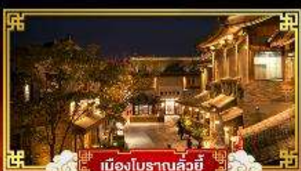
เมืองโบราณลั่วหยี่