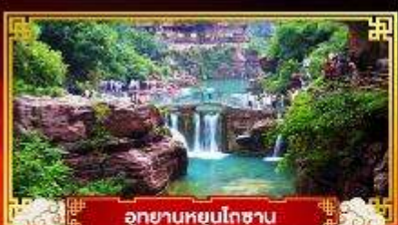
อุทยานหยุนโกซาน

“ซีอาน” อารยธรรมโบราณอายุสามพันปี มหาสุสานของจักรพรรดิจีน ..จีนซีฮ่องเต้