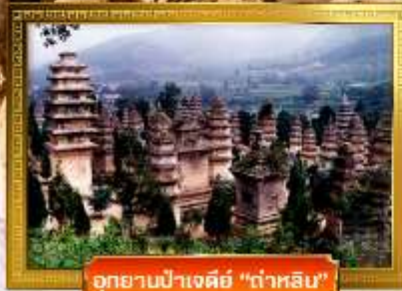
อุทยานป่าเจดีย์ "ต้าหลิน"