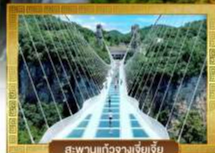
สะพานแก้วจางเจียเจีย