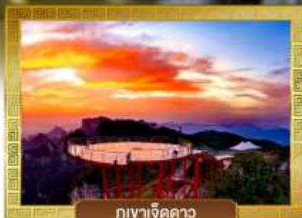
กุเวาเจ็ดดาว