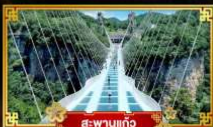
สะพานแก้ว