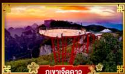
กุเขาเจ็ดดาว