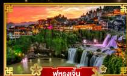
ฟุรงเจิน