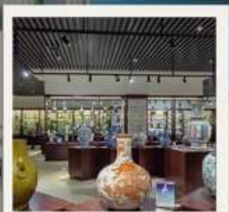
JINGDEZHEN CERAMIC MUSEUM