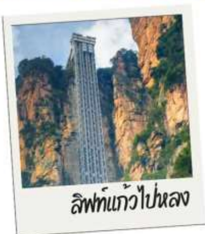
ลิฟท์แก้วไปขนส่ง