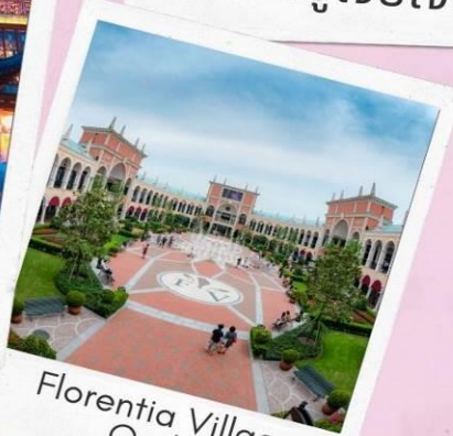
Florentia Village Outlet