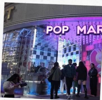
ถนนนานกิง