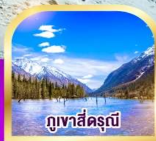
ภูเขาสัตร์ณี