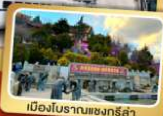
เมืองโบราณแชงกรี่ล่า