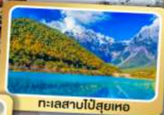
ทะเลสาบโป๋สุยเหอ