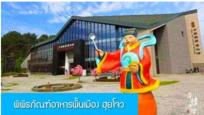
พิพิธภัณฑ์อาหารพื้นเมือง สุยโจว

เที่ยง อาหารเช้ามื้อกลางวัน ( ท่านสามารถเลือกชิมอาหารพื้นเมืองในระแวกโรงแรมได้ตามอัชยาศัย )