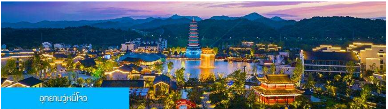
อุทยานวูหนี่โจว