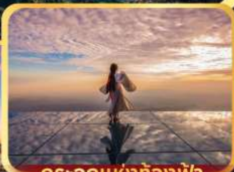
กระเจกแห่งท้องฟ้า