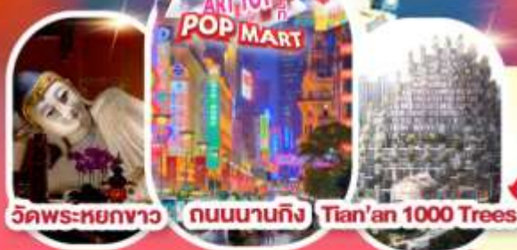
วัดพระหยกขาว ถนนนานกิง Tian'an 1000 Trees