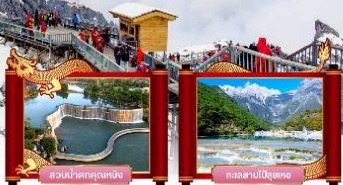
สวนน้ำตกคุณหมิง

✓ พิเศษ! ไขว่จางอวี่โหม่ว "ความประหลาดใจสีเขียว"