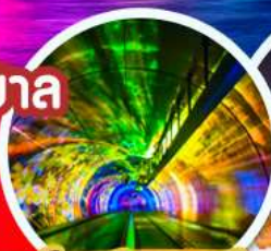
จูโมงด์เลเซอร์