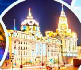
เดอะบันด์