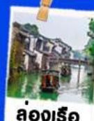
ล่องเรือ