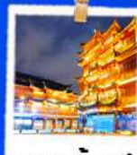
ตลาดร้อยปี