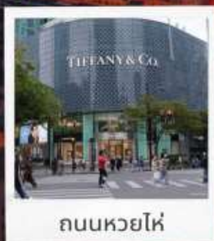
ถนนหวยไห่