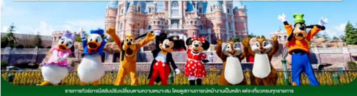
รายการทัวร์อาจมีฉบับปรับปรุงเปลี่ยนแปลงตามความเหมาะสม โดยดูสถานการณ์หน้างานเป็นหลัก แต่จะเกี่ยวข้องทุกรายการ