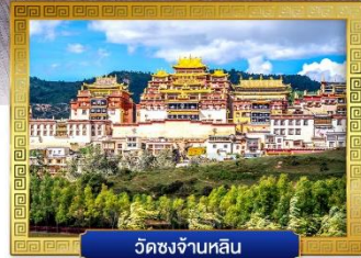
วัดชงจ้านหลิน