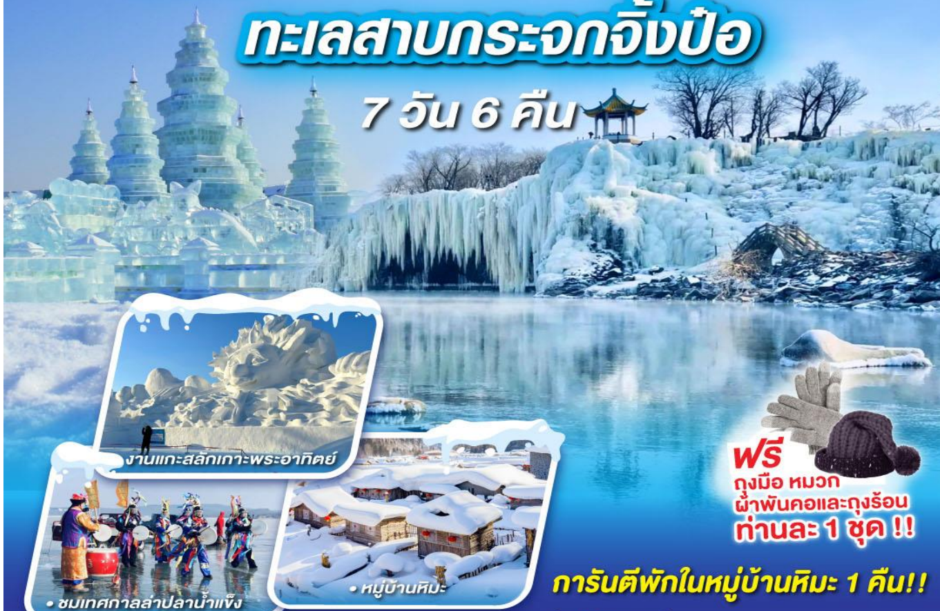
งานแกะสลักเกาะพระอาทิตย์