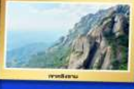
เขาตีสถาน