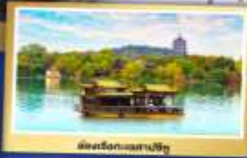
เมืองริ่งกวงเสสปิงอู๋