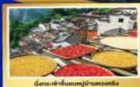
นิคมหมู่บ้านชนบทโบราณหวงหลิง