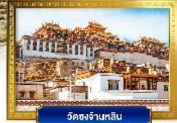
วัดชงจันหลิน