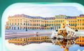
พระราชวังเชินบรุนน์