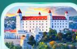
ปราสาทปราตีสลวา

เที่ยวชมเมืองออสเตรียที่หมู่บ้านริบะเลสาบสวยที่สุดในโลก พระราชวังเชินบรุนน์ เมืองลินซ์ จิตรกรรมฝาผนังที่ สันติเมืองมรดกโลก เซสกี ครอบลอฟ เยี่ยมชมปราสาทปราก ถนนทองคำ เชิ่คอินสถานที่ชื่อดัง! ปราสาทปราตีสลวา ส่องเรือชมความงามแม่น้ำดานูบ แม่น้ำที่ยาวที่สุดในยุโรป ชมความน่าหลงใหลของ ปราสาทบูคาเปสต์ สะพานชาร์ลส์