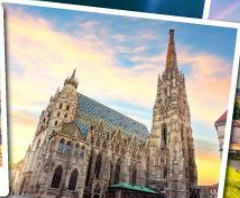
มหาวิหารเซนต์สตีเฟน