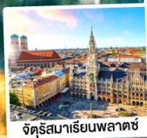
จัตุรัสมาเรียนพลาตซ์