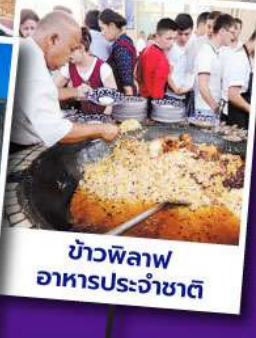
ข้าวพิลอฟ อาหารประจำชาติ